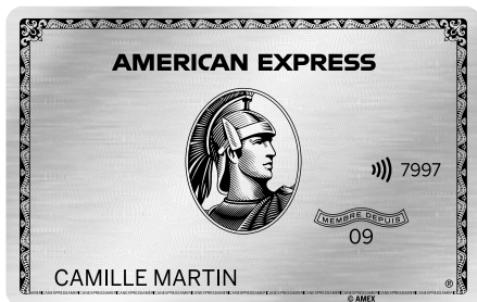
CARTE PLATINUM EN MÉTAL