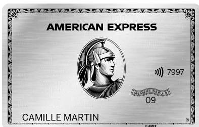
CARTE PLATINUM EN MÉTAL