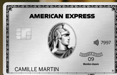
CARTE PLATINUM AMERICAN EXPRESS®