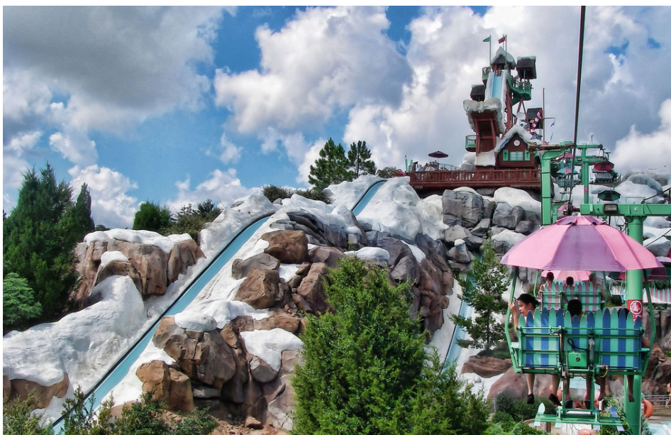
Acima: Busch Gardens (foto de divulgação) Canto Inferior Esquerdo Blizzard Beach (foto de divulgação)

Clássicos do cinema como Tubarão, E.T., Exterminador do Futuro, entre outros, estão representados no parque Universal Studios . As melhores atrações são a Revenge of The Mummy Ride, a montanha-russa temática do filme A Múmia, e para os saudosistas é imperdível o E.T. Adventure. A antiga atração baseada em De Volta Para o Futuro foi substituída em 2008 pelo simulador dos Simpsons, também imperdível para quem é fã do seriado. O mais recente parque da Universal, o The Islands of Adventure , tem uma área inteira dedicada ao filme Jurassic Park, outra com o tema Marvel Super Hero Island – que inclui o simulador do Homem-Aranha e a montanha-russa Incredible Hulk –, além do recém inaugurado Wizarding World of Harry Potter, com brinquedos e cenários temáticos.