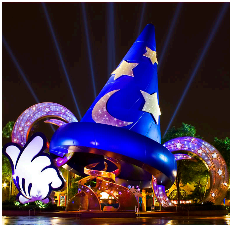
Disney's Hollywood Studios (foto de divulgação)

INFORMAÇÕES AO TURISTA: Orlando Travel & Visitors Bureau Tel.: +1 800 972-3304 Visitors Center Endereço: 8723 International Drive, Suíte 101, Orlando, FL 32819 Horário de Funcionamento: 8h30m – 18h30m diariamente Tel.: +1 407-363-5872, www.orlandoinfo.com