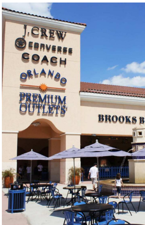
Acima: Mall at Millenia (foto de divulgação) Canto Inferior Esquerdo Orlando Premium Outlet (foto de divulgação)

Zonko's www.universalorlando.com +1 407 363 8000