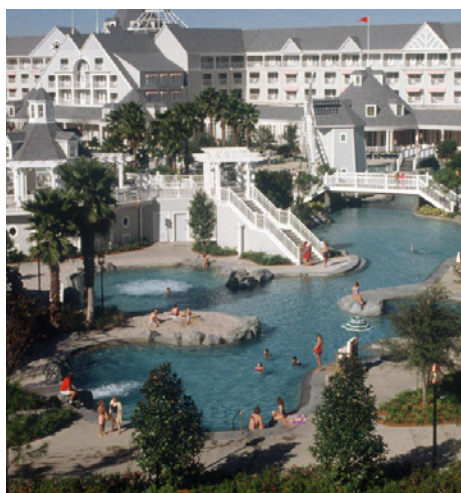
Acima: Hotel Royal Pacific (foto de divulgação) Canto Inferior Esquerdo: Hotel Disney's Beach Club (foto de divulgação)

O que não falta em Orlando são opções de hotéis de todos os tipos. Sempre terá um perfeito para a sua situação. Só dentro da própria Disney, são 25 tipos de acomodações, de resorts de luxo a campings. Os complexos do Disney's Beach Club , Disney's Yacht Club e Disney's Boardwalk Villas , no parque Epcot, oferecem luxo e comodidade no padrão cinco-estrelas para seus hóspedes. Ainda na área dos parques existem os resorts temáticos All Star Movies , All Star Music e All Star Sports , por diárias menores e transporte direto para as atrações. Para quem gosta de aventura, o hotel Animal Kingdom Lodge fica dentro do parque Animal Kingdom, cercado por 13 hectares de savana tropical. A Universal Studios também oferece três hotéis: o Royal Pacific , com seu famoso jardim de orquídeas na recepção, o temático Hard Rock , com muito rock rolando a todo o momento nas caixas de som – até mesmo dentro da piscina – e o Portofino Bay , inspirado nas cidades litorâneas da Itália, uma das propriedades mais luxuosas de toda a Flórida. Quem prefere a liberdade de ficar mais próximo aos shoppings e outlets tem como opção os hotéis fora dos parques. Uma dica é o Comfort Inn International , na International Drive, no centro da cidade.