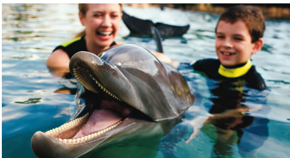
Acima: Downtown Disney (foto de divulgação) | Canto Inferior Esquerdo: Discovery Cove (foto de divulgação)

Depois de passar dias exaustivos caminhando ao longo dos parques e aproveitando as atrações, nada como dar uma relaxada na Downtown Disney , um espaço agradável à beira do lago Buena Vista com lojas, restaurantes e bares. É lá que fica o Cirque du Soleil La Nouba , espetáculo imperdível para quem deseja passar uma noite fantástica em Orlando. O Universal Citywalk oferece bares com música ao vivo, restaurantes e diversão noturna muito além dos parques. Com dois hotéis embutidos, o Disney's Boardwalk é uma mini-cidade inspirada nos anos 30, com bares, lojas e quiosques. Quer contato com a natureza, tranquilidade e belas paisagens? O parque Discovery Cove , do SeaWorld, reúne praias com areia branquinha e águas transparentes. O contato com a natureza é elevado ao máximo: os visitantes podem nadar com os golfinhos e raias ou mergulhar em meio aos recifes de corais, com milhares de peixes e espécies marinhas. Para fãs do esporte, um dia no ESPN Wide World of Sports é ideal: são doze quadras de tênis, campos de golfe, de futebol, quadras de basquete, vôlei, pistas de hóquei e muito mais. Já os fãs de tecnologia vão curtir passar o dia no Kennedy Space Center , uma base da NASA onde é possível assistir o lançamento de foguetes, além de viver a experiência de ser um astronauta por um dia.